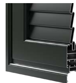
OVALINA FISSA CHIUSA