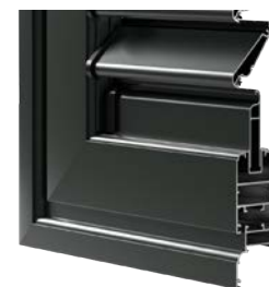
LAMELLA FISSA APERTA