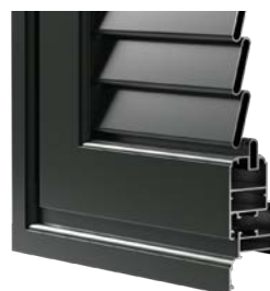
OVALINA FISSA APERTA