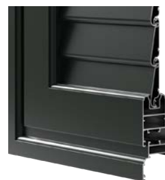
LAMELLA FISSA CHIUSA